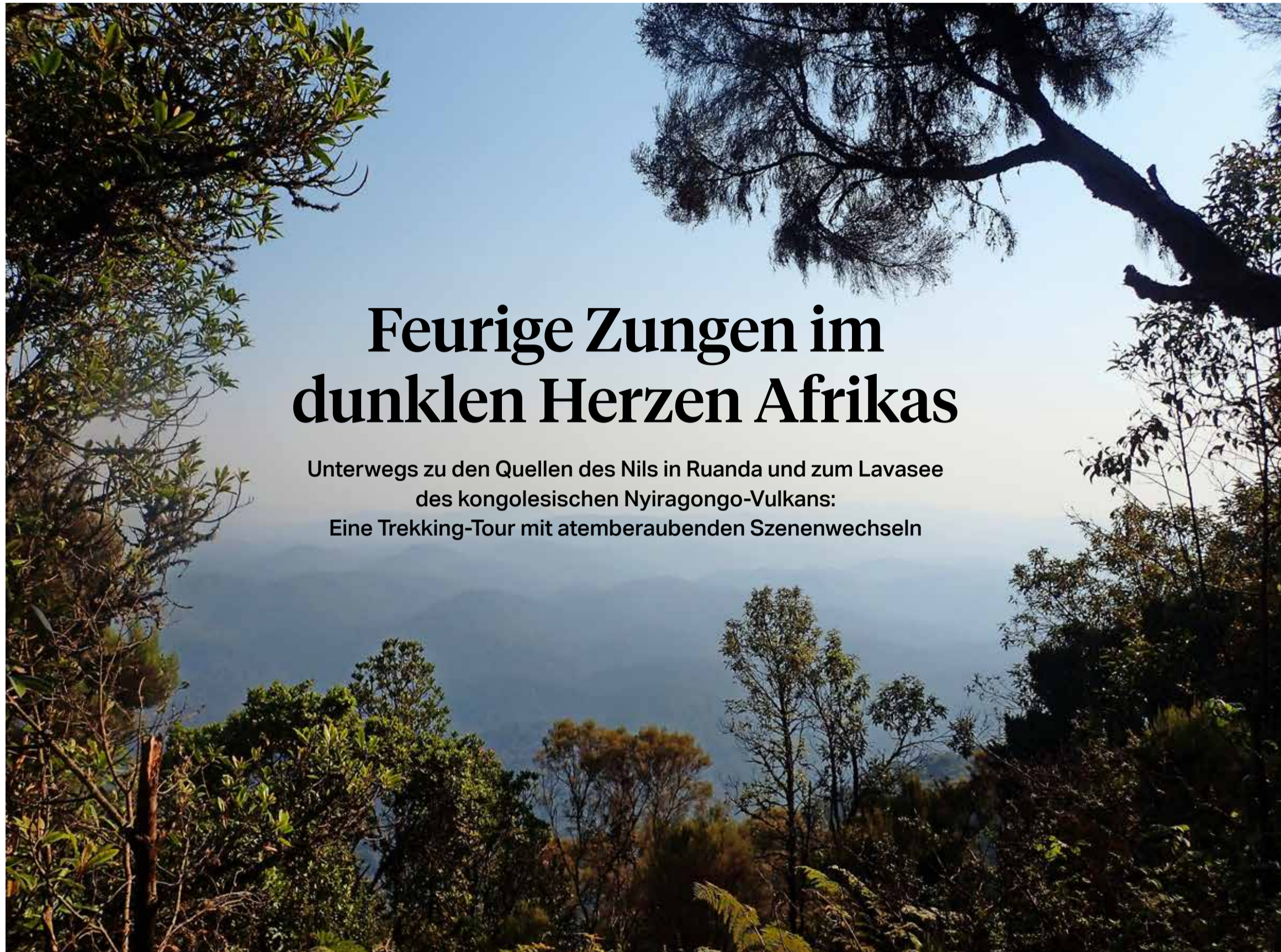
Blick vom Congo-Nile Divide Trail auf den Nyungwe-Wald: Die beiden Nilquellen liegen versteckt in den Hügeln Ruandas

Unterwegs zu den Quellen des Nils in Ruanda und zum Lavasee des kongolesischen Nyiragongo-Vulkans: Eine Trekking-Tour mit atemberaubenden Szenenwechseln